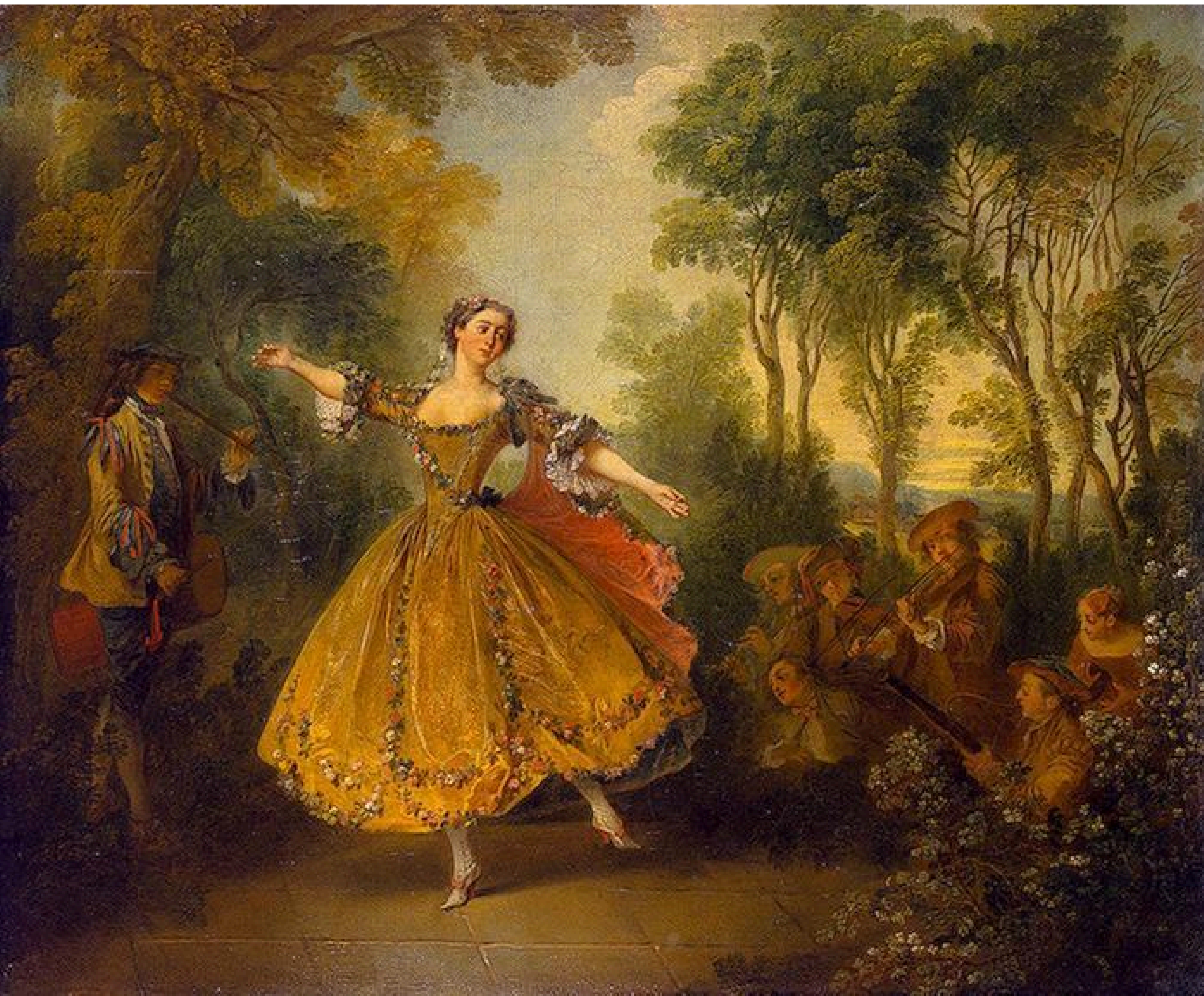
Ланкре, Никола (1690-1743) Танцовщица Камарго 1700-1750 гг. Эрмитаж, Санкт-Петербург