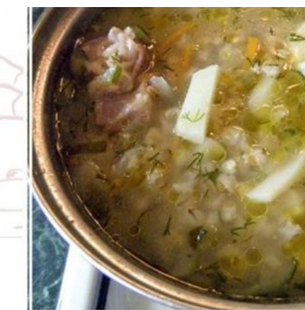
СУП ИЗ ЗАМОРОЖЕНОГО МЯСА