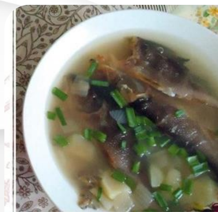
СУП ИЗ СУЖИКА