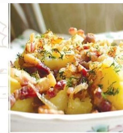
СОЛЁНЫЕ ЗИРЫ СО ШКВАРКАМИ